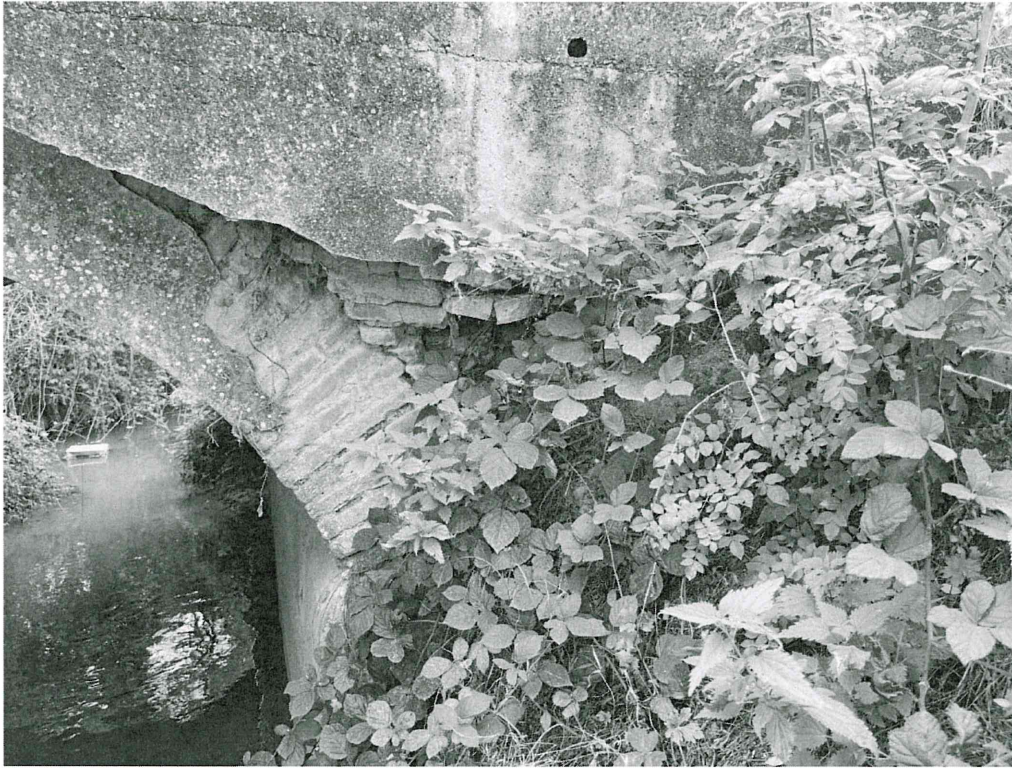
Détail de l'effondrement du tympan rive gauche aval