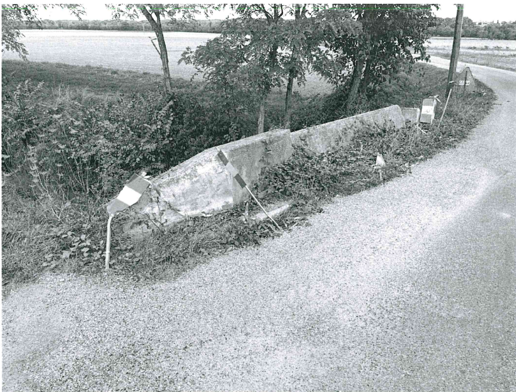
Affaissement de l'accotement rive gauche aval, la signalisation déjà mis en place a été choquée également