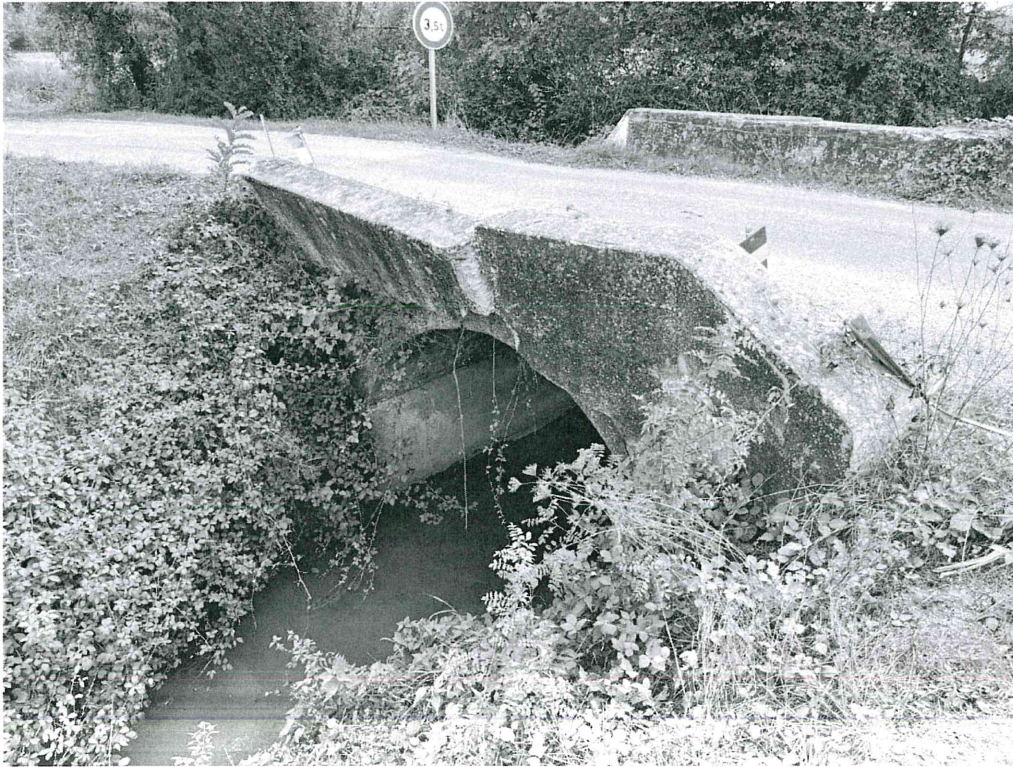
Choc important sur le parapet aval ayant entraîné l'effondrement du mur tympan rive gauche aval